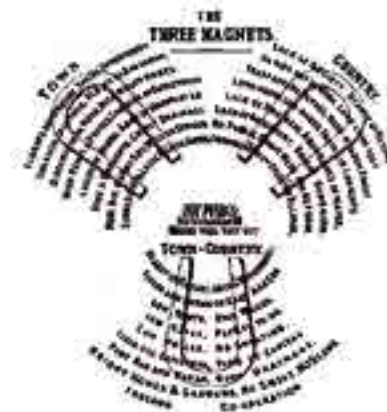
Les Trois Aimants de Howard, Tomorrow : A Peaceful Path to Real Reform , 1898