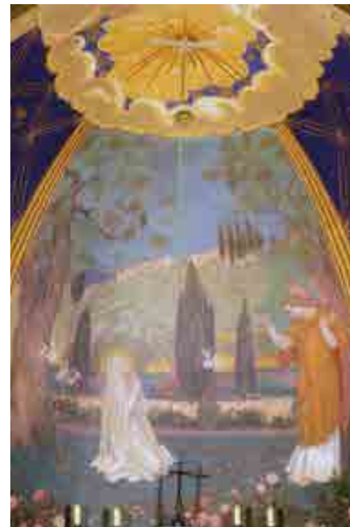
Annonciation de Maurice Denis