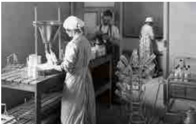
Goutte de lait à la Maison de l'Enfance - Le Foyer Rémois

Bien que destinés à de grandes familles, ces logements présentent des pièces de petites dimensions, en moyenne au nombre de quatre (salle commune / cuisine, chambre des parents, chambre des filles, chambre des garçons). Les éléments de confort principaux sont les WC intérieurs reliés au tout à l'égout et un point d'eau froide dans la salle commune.