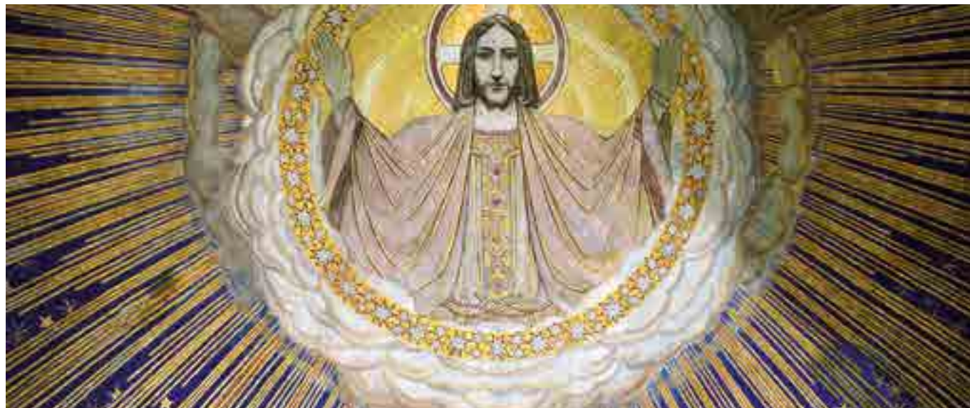
Christ au-dessus du maître-autel de l'Église Saint-Nicaise