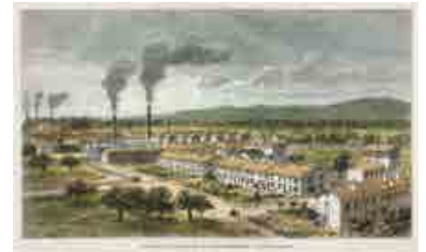
Cités ouvrières de Mulhouse