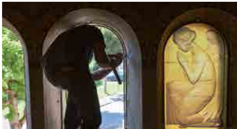
Dépose des verrières, Lalique © Dominique Potier

À la fin du XX e siècle, Le Foyer Rémois, toujours propriétaire de la cité-jardin du Chemin-Vert a entrepris une grande campagne de réhabilitation. Au niveau des maisons, les bâtiments ont été isolés par l'extérieur et les façades ont fait l'objet d'une mise en couleur, égayant le quartier. L'ensemble des menuiseries ont été remplacées. Des transformations ont aussi été apportées aux intérieurs : regroupement de deux logements pour en faire un plus grand, installation de pièces d'eau à l'étage... Les adjonctions réalisées au fil du temps ont été supprimées pour redonner à l'ensemble sa cohérence. De tous les équipements, seuls ne fonctionnent plus les centres commerciaux.