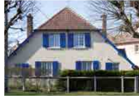
Maison jumelée