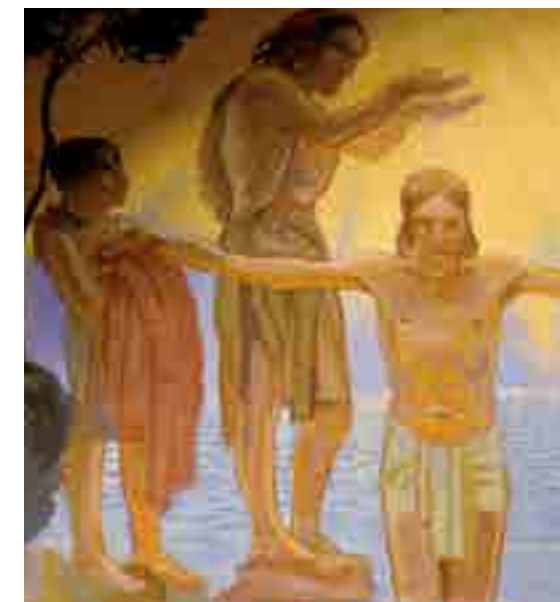
Baptême de Jésus par Jean-Baptiste © Dominique Potier

Il peint les deux toiles marouflées des absides du transept. Les thèmes retenus, l'Annonciation et la Sainte-Famille, sont dans l'esprit du Chemin-Vert.