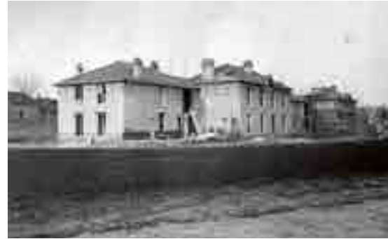
Constructions sur le boulevard Dauphinot en 1913 - Le Foyer Rémois

Les cités-jardins s'étendant sur plusieurs hectares, ces projets dépassent le simple cadre de l'architecture pour passer à l'échelle de l'urbanisme.