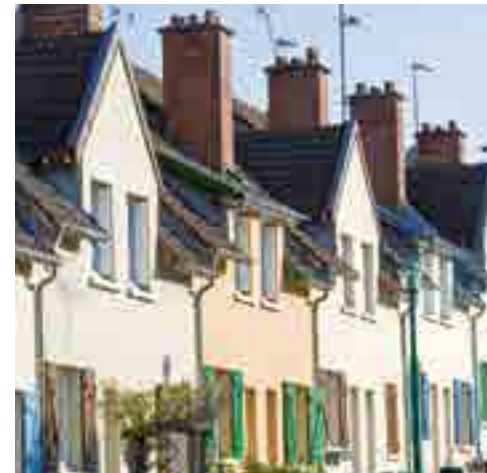
Maisons en bandes © Pascal Stritt