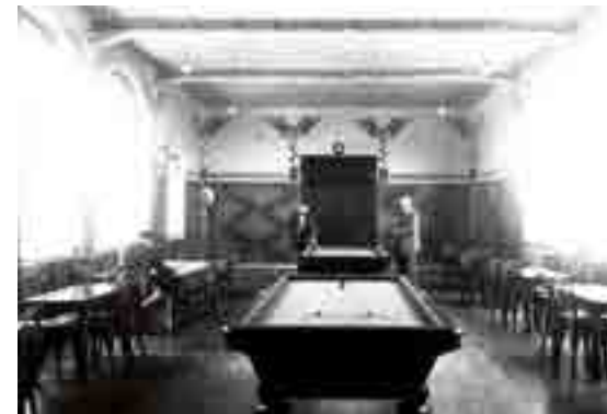
Salle de billard Maison Commune - Le Foyer Rémois

Le quartier du Chemin-Vert ne sera jamais relié au centre-ville par le tramway ce qui le met dans un relatif isolement. Afin de ne pas pénaliser les habitants, deux centres commerciaux sont implantés. On y retrouve les grandes enseignes du succursalisme rémois (Goulet-Turpin, Familistère, Comptoirs français, Etablissements économiques) qui assurent l'approvisionnement en produits frais et épicerie. Chez le boulanger et le boucher, les locataires disposent de bons de réduction accordés par Le Foyer Rémois.