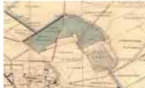
Extrait du plan Fond intégrant la future Cité-jardin du Foyer Rémois 41FI245