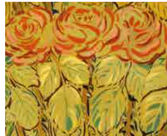
Détail des fresques du théâtre