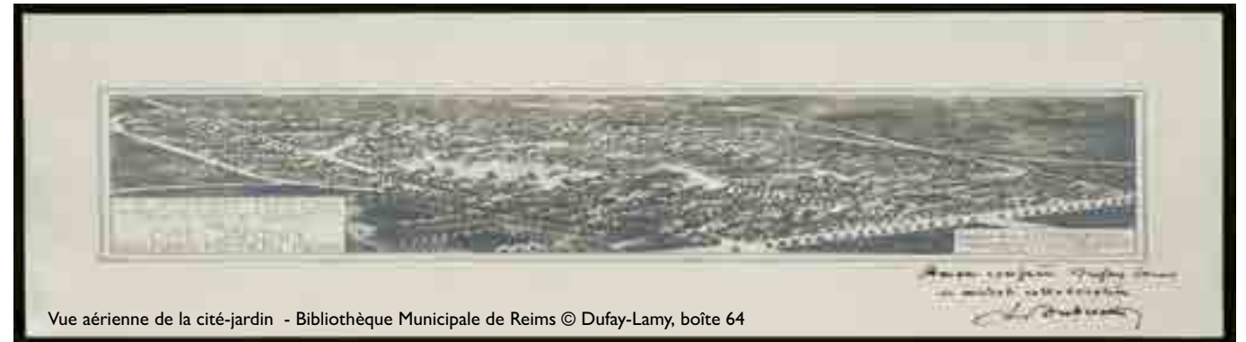
Vue aérienne de la cité-jardin - Bibliothèque Municipale de Reims © Dufay-Lamy, boîte 64