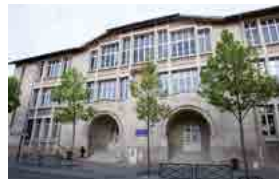
Façade de l'école Pommery

Œuvre de Max Sainsaulieu, architecte de la bibliothèque Carnegie, le groupe scolaire est prévu pour accueillir 5 classes de garçons, 5 classes de filles et 3 classes de maternelles. Ouvert en 1924, il comptabilise jusqu'à 650 élèves.