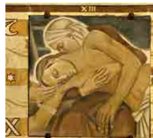
Station XIII du chemin de croix

Pour le chemin de croix, Georges Charbonneaux fait appel à Jean Berque, jeune artiste rémois. Ses 14 stations, en fibrociment, dans un camaïeu de bleus et ocres, prennent le parti d'une approche intimiste et humanisée. Bien que contesté, à l'époque par le clergé, ce parti pris artistique sera imposé par Georges Charbonneaux.