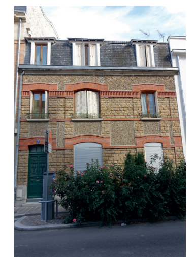
3 7 rue Linguet (Régionalisme)