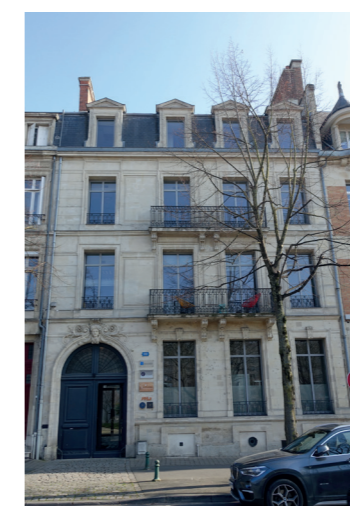
1 19 boulevard Foch (fin XIX-début du XXe s)