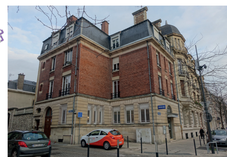
4 7 rue des Boucheries (Éclectisme)