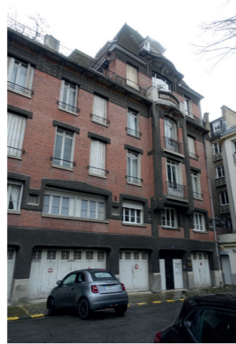
8 8 Place du Chapitre (Art Déco)