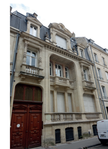
2 12 rue du Général Sarrail (fin XIX-début du XXe s)