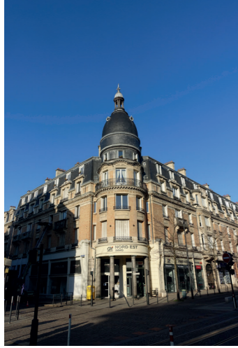
6 29-35 cours Jean-Baptiste Langlet (Éclectisme)