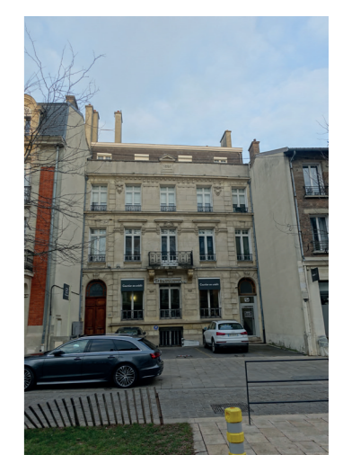
5 32 Cours Jean-Baptiste Langlet (fin XIX-début du XXe s)