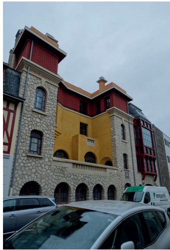
11 44 rue Ponsardin (Éclectisme)