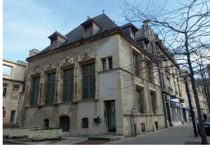
7 16 cours Jean-Baptiste Langlet (Historicisme)