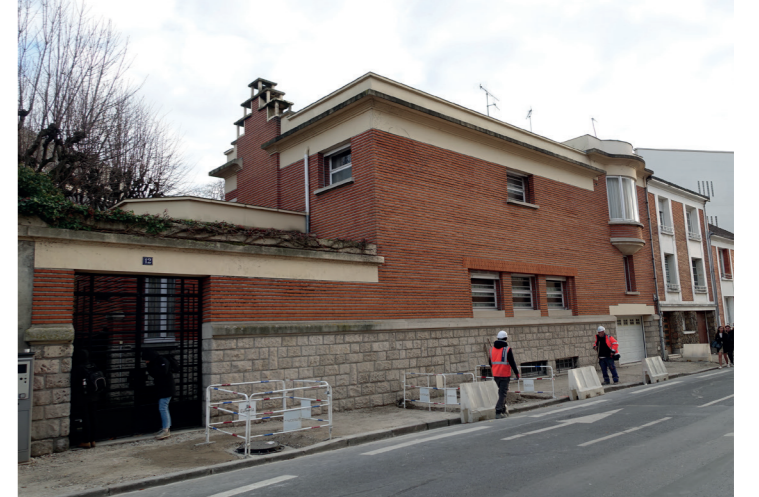
10 12 rue Voltaire (Mouvement Moderne)