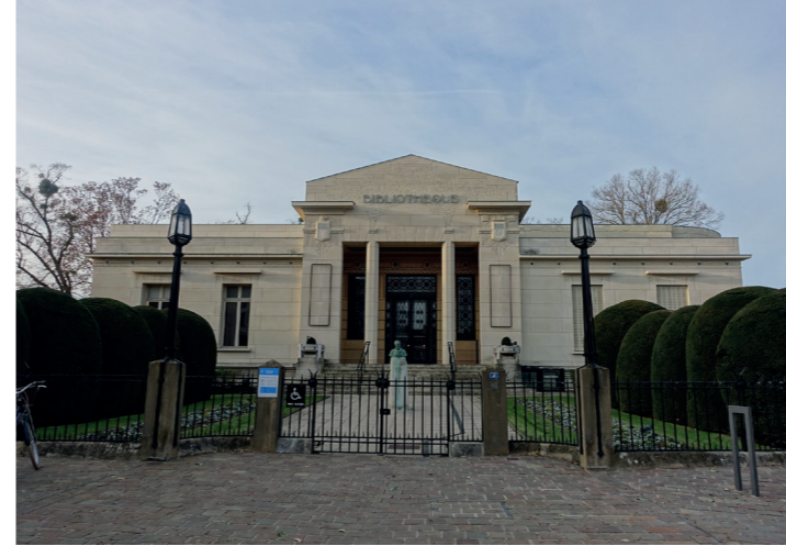
9 8 Place Carnegie (Art Déco)