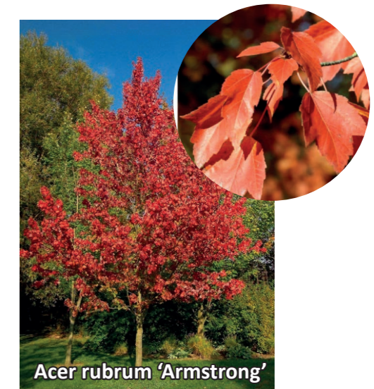
Acer rubrum 'Armstrong'

● Espèces végétales indigènes (ou naturalisées)