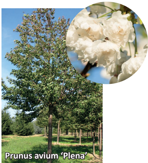
Prunus avium 'Plena'