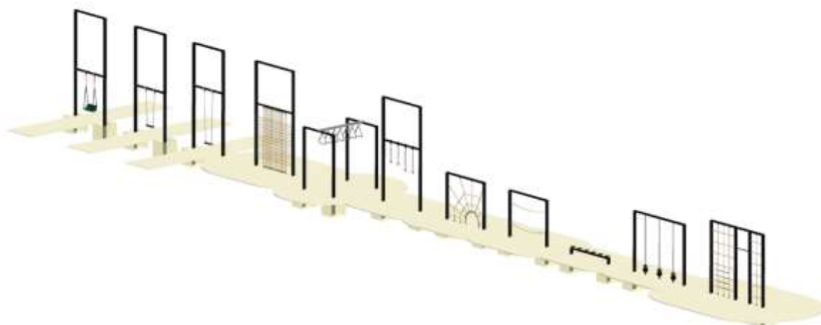
Ligne architecturale des jeux et de la passerelle © Osty & associés