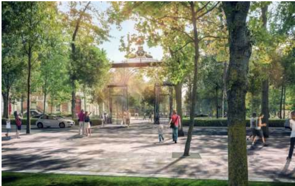
La Porte de Paris

Désormais ouverte et franchissable, la Porte de Paris retrouve sa vocation initiale : au sein d'un carrefour entièrement repensé, elle articule les flux véhicules et piétons et devient l'entrée du parc de la patte-d'oie et des basses Promenades. Elle confère au lieu une dimension métropolitaine en tournant les parcs vers le Canal.