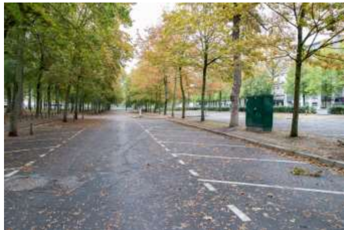
Les basses Promenades avant travaux

En 2015, en s'appuyant sur ce constat, l'équipe emmenée par Arnaud Robinet et Catherine Vautrin propose aux Rémoises et aux Rémois de partager une « nouvelle vision » pour leur ville.