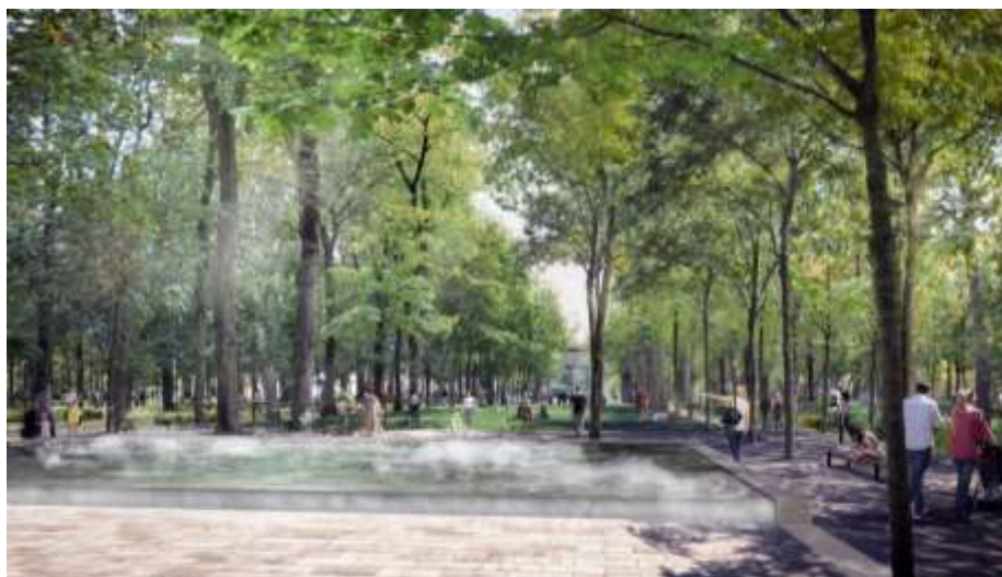
Le « Bassin des brumes » © Osty & associés

À intervalles réguliers des petits jets d'eau dénommés « waterpop » (gouttes d'eau en lévitation) viennent animer la surface de l'eau telles des bulles de Champagne. Ces jets permettent de créer des séquences rapides et variées formant un effet effervescent ou encore des petits tronçons d'eau en mouvement, soit verticalement soit linéairement. Les bassins seront également programmés pour se couvrir temporairement d'un tapis brume afin de varier les effets.