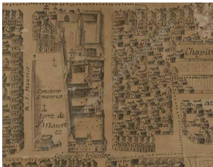
(AMCR, extrait du plan de Reims de 1665).

Maurice qui est à tout près de l'hôtel de Cerny et font construire le superbe ensemble qui existe encore aujourd'hui.