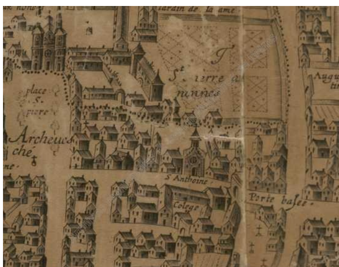
(Archives municipales et communautaires de Reims, AMCR, extrait du plan de Reims de 1665)