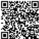
Spectacle S2TMD 2022 au grand auditorium du CRR

+ d'informations + d'actualités sur crr-reims.fr