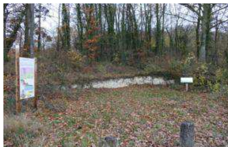
PANNEAUX SUR LA BEURGE ET LA CRAIE