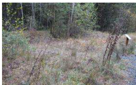
PANNEAUX SUR LA CHAUVE-SOURIS ET LES ZONES HUMIDES