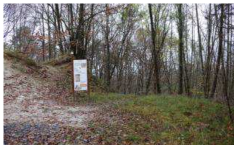
PANNEAUX SUR LA LIGNITE ET LE SABLE