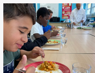
Les enfants apprécient les plats végétariens