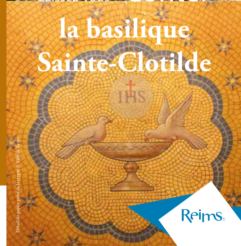
Détail du papier peint de la crypte