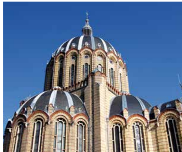
Dômes de la basilique

La tradition se poursuit jusqu'à aujourd'hui où l'on compte quatre cent deux reliquaires renfermant près de trois mille reliques de saints. Parmi celles-ci se distinguent plusieurs types de reliquaires : ceux imitant l'architecture d'une église ou la forme de la croix, ceux évoquant directement le saint et ceux symbolisant l'Ascension du saint sous la forme d'un ange.