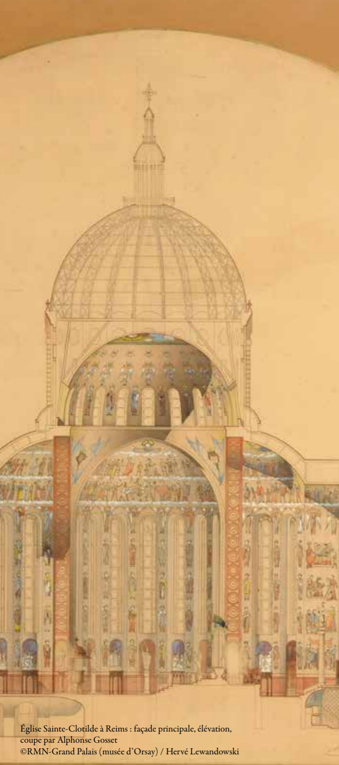
Église Sainte-Clotilde à Reims : façade principale, élévation, coupe par Alphonse Gosset