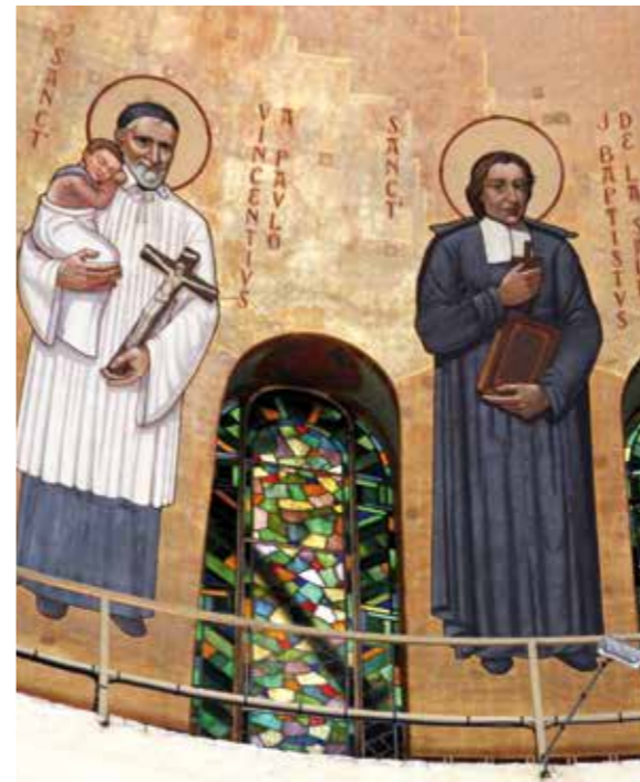
Détails des saints Vincent de Paul et Jean-Baptiste de la Salle

L'élément décoratif principal de la basilique se situe sous la coupole. Conformément au style byzantin, l'architecture doit amener l'œil du visiteur au sommet où est représenté un Christ Pantocrator sur fond doré. De face, il fait le geste de la bénédiction et tient un globe. La composition est tripartite : le Christ au centre, entouré d'anges, puis un autre cercle avec des saints et des figures de l'histoire religieuse locale ou nationale. On peut identifier entre autres : Charlemagne, le pape Urbain II, le roi Saint-Louis, Saint-Jean-Baptiste de la Salle, Saint-Bernard de Clairvaux, Saint-Nicaise, Saint-Remi... En raison d'un manque de fonds, la décoration est restée inachevée en certains points. Pour la coupole, des toiles marouflées ont été posées à la place des peintures initiales.