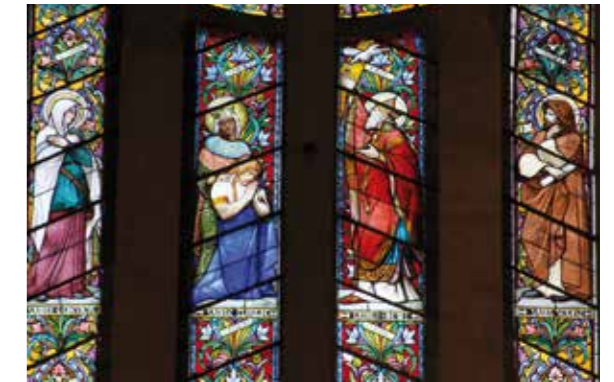
Vitrail du baptême de Clovis

Les vitraux ont été réalisés dans les années 1920 par les sœurs De Troeyer. Sur la façade orientale, un vitrail représente le baptême de Clovis. On voit saint Remi en rouge, le bras tendu vers la colombe apportant le saint-chrême. Clovis est agenouillé tandis que Clotilde prie près de lui. Des saints se trouvent derrière eux. Sur les autres vitraux figurent Jeanne d'Arc et les saints de France. Enfin, les vitraux de la chapelle de Notre-Dame de France évoquent les sites français où l'on vénère la Vierge.