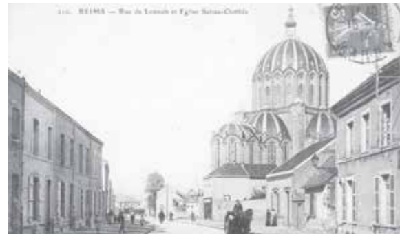
La basilique Sainte-Clotilde vue de la rue de Louvois

En 1896, le cardinal Langénieux, archevêque de Reims, souhaite commémorer le 14 e centenaire du baptême de Clovis, premier roi de France chrétien. La tâche n'est pas simple car il règne alors un climat anticlérical dans la ville. Les radicaux viennent de fêter le centenaire de la Révolution, les chrétiens veulent s'imposer en célébrant le baptême de Clovis. Le cardinal décide la construction d'une grande église en hommage à Clotilde, femme de Clovis, qui a conduit le roi au baptême. Il souhaite également que le monument soit un reliquaire de la France chrétienne. Les habitants s'opposent d'abord à ce projet mais l'acceptent plus tard lorsque la congrégation des filles du Sacré-Cœur de Marie s'y installe. Elles apportent soins aux malades, enseignement et aide aux démunis du quartier.